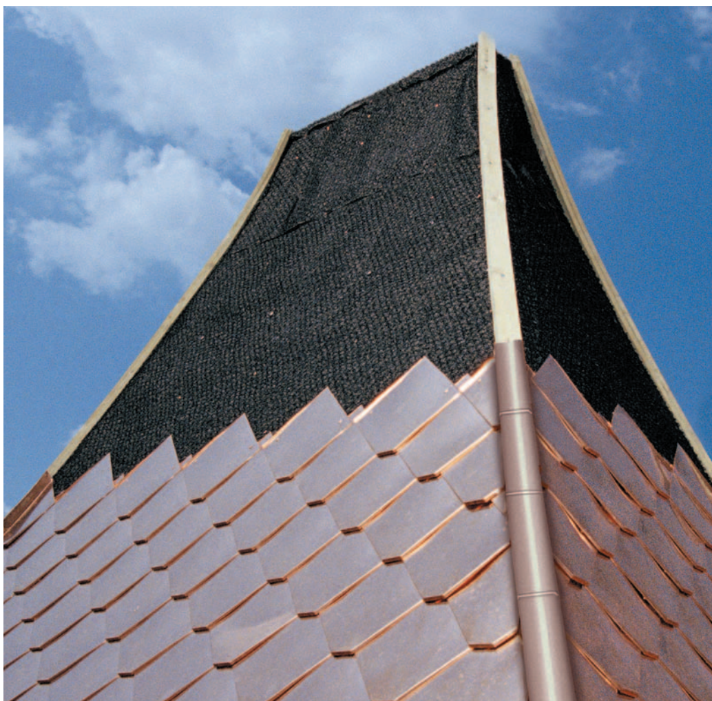
A DELTA®-TRELA PLUSZ optimális elválasztó réteg a nagyértékű fémlemezfedéseknél.